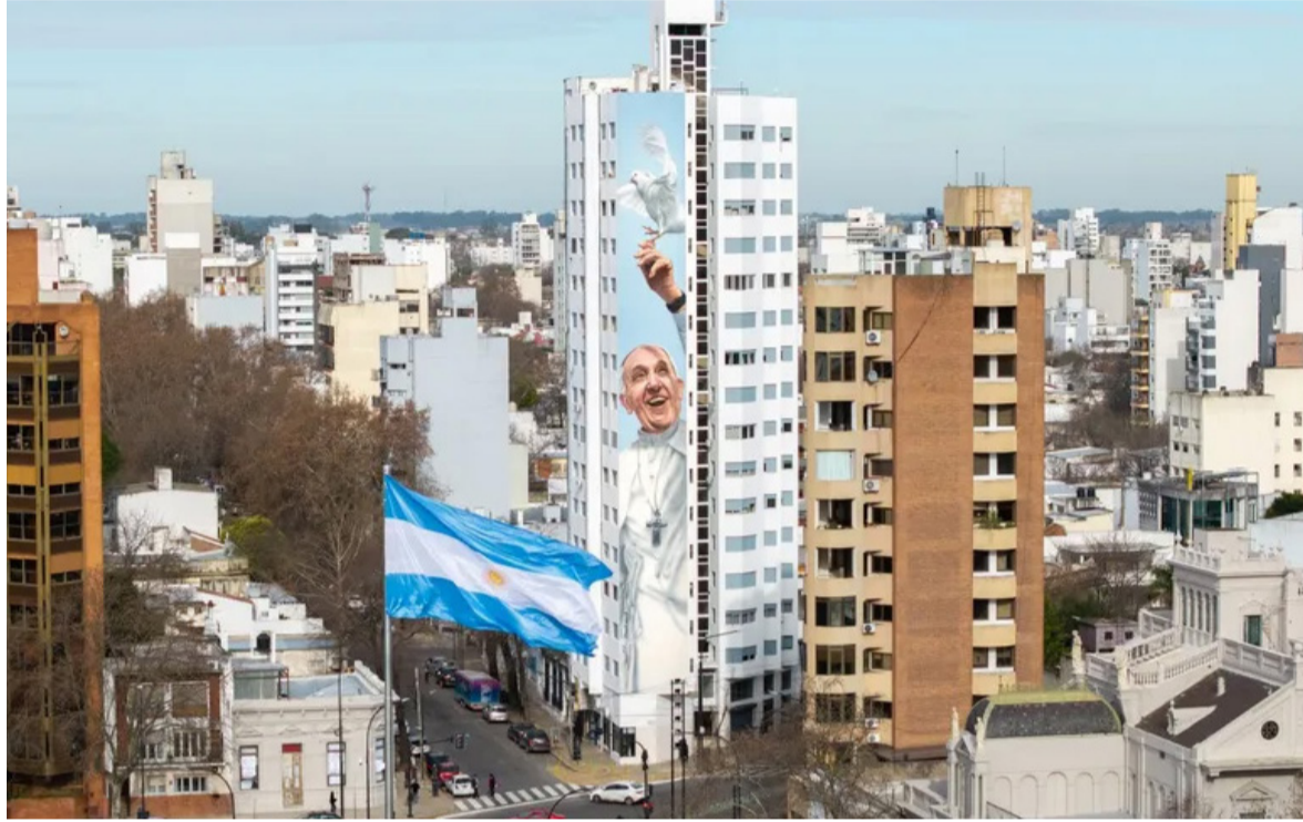
El mural más grande del mundo en homenaje al papa Francisco en La Plata.