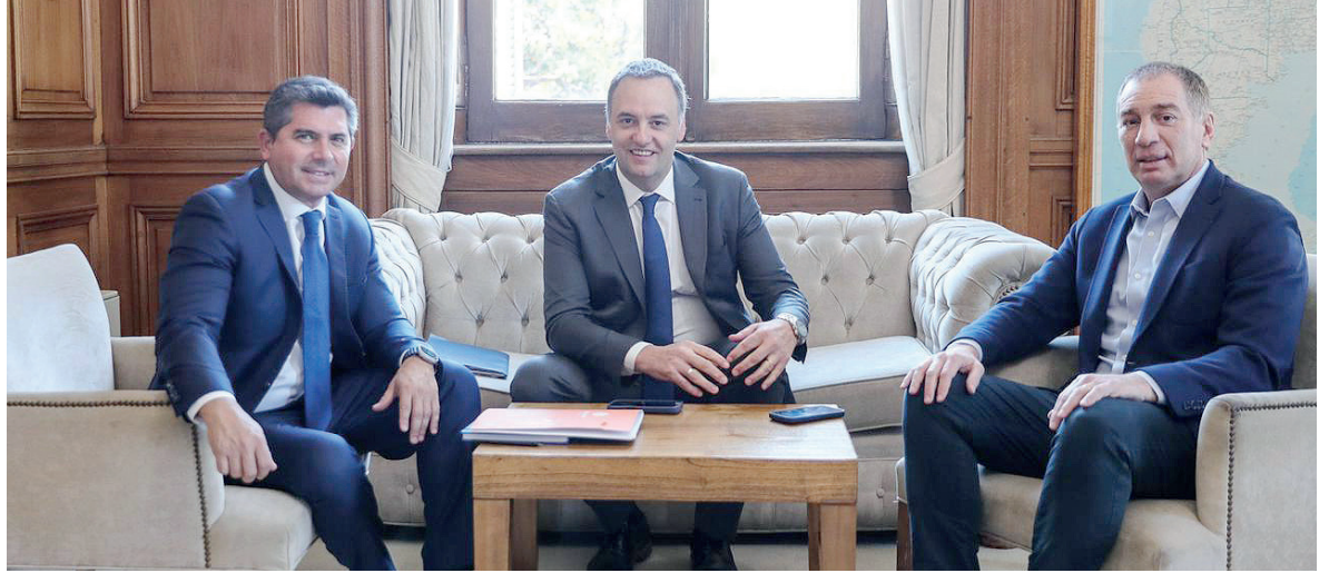
Cara a cara. Diego Santilli, Manuel Adorni y el sanjuanino Marcelo Orrego.

Consultado sobre la reforma laboral, uno de los ejes centrales del paquete de medidas que el Gobierno prepara, Llaryora sostuvo que aún "no hay ningún proyecto presentado" y llamó a enfocarse en la informalidad laboral, en es-