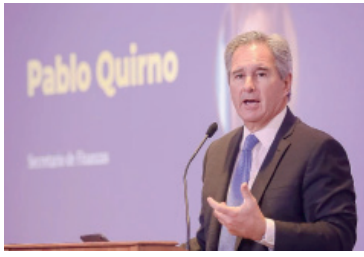
El canciller Pablo Quirno.

Quirno viaja a EE.UU. por el acuerdo de libre comercio