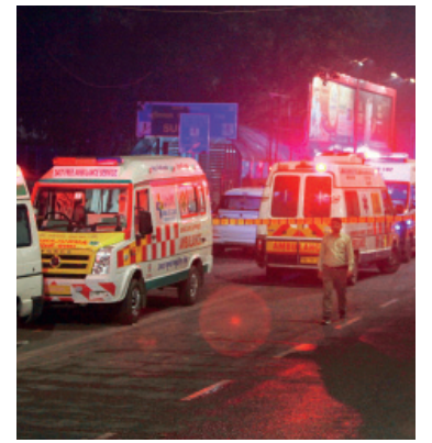
Las ambulancias llegan al lugar donde explotó un automóvil cerca del histórico Fuerte Rojo.

Ocho muertos y 19 heridos al explotar un auto en la India