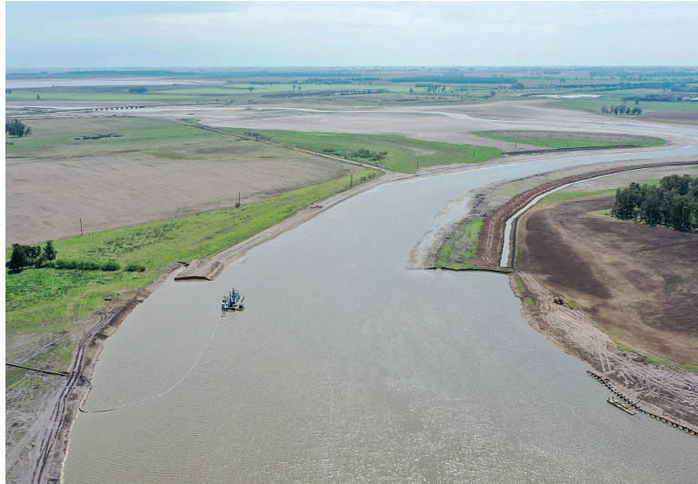
En carpeta. Provincia proyecta la finalización del Plan Maestro Integral de la cuenca del río Salado.

En ese sentido, reconoció que hay una etapa 5 que le corresponde a la Provincia, que ya cuenta con los fondos comprometidos de un organismo internacional. Pero todo dependerá de que el gobierno de Milei termine la parte que le corresponde y que, según dijo Patricia Bullrich en la ciudad de