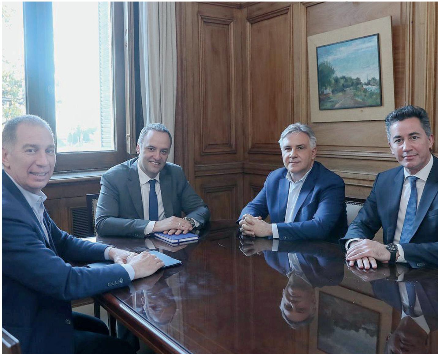
El gobernador de Córdoba destacó el encuentro como "cordial y productivo", pero planteó algunos cambios al proyecto de Presupuesto.