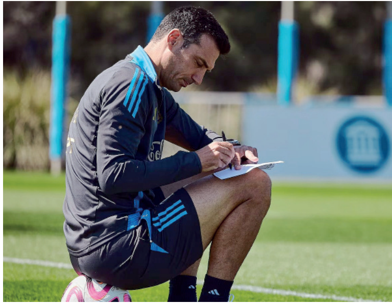
Toma nota. El DT deberá rediseñar el armado del equipo.

El caso de los futbolistas del club español responde a las estrictas normas sanitarias exigidas por el gobierno local, que incluyen, además de la vacuna mencionada, otras inoculaciones recomendadas contra la poliomielitis, hepatitis A, fiebre tifoidea, cólera y meningitis meningocócica, entre otras. Algunas instituciones europeas suelen limitar la aplicación de determinadas vacunas duran-