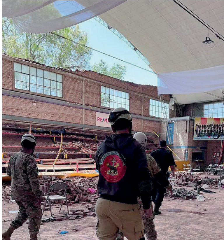
Derrumbe. El techo de la institución se derrumbó mientras se desarrollaba un evento de patín.

La conducta imprudente de Ginóbili generó un peligro común, que ocasionó la muerte de