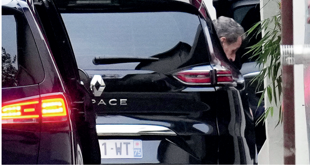
Monitoreado. El Tribunal de Apelación de París dispuso que continúe bajo control judicial.

La defensa del expresidente había solicitado su liberación poco después de su ingreso a prisión, argumentando que no existía riesgo de fuga ni posibilidad de manipular pruebas, ya que toda su familia reside en Francia y las investigaciones se encuentran