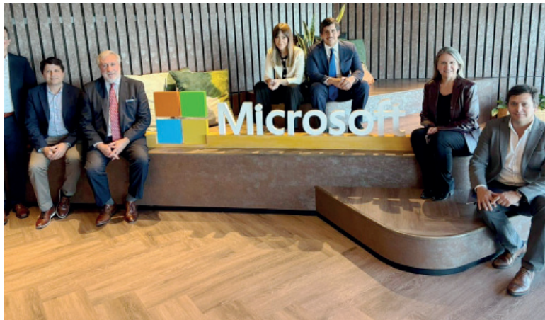
Alfabetización digital. El convenio sienta las bases para una cooperación estratégica orientada a ese objetivo.

La firma de este convenio con Microsoft, según Conte Grand, “constituye un hecho de extraordinaria relevancia institucional y marca un nuevo impulso” en el plan de transformación digital. “Esta alianza nos permitirá fortalecer la alfabetización digital de nuestros equipos, ampliar su formación en habilidades tecnológicas clave y seguir promoviendo un uso ético y estratégico de la inteligencia artificial, siempre bajo una visión humanista que