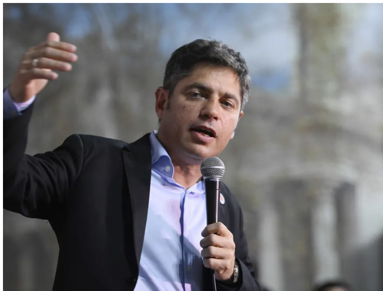
Axel Kicillof le envió una dura carta al presidente Javier Milei.

Economía también cuestionó las consecuencias del plan de ajuste económico del Gobierno. Señaló que distintos sectores de la población -como jubilados, trabajadores, comerciantes y estudiantes- sufren una recesión que provoca una “feroz caída del consumo y las ventas”, así como “angustia y desesperación” entre millones de argentinos.