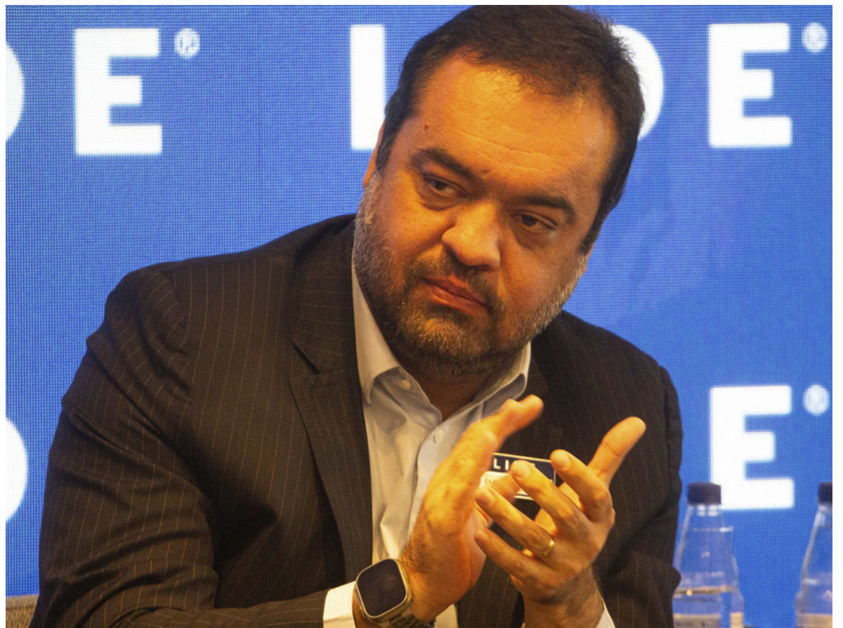
Claudio Castro, gobernador de Río de Janeiro.

El gobernador Claudio Castro defendió el operativo antinarco que dejó 121 muertos en las favelas de Río de Janeiro y aseguró que fue “un hito en la lucha contra el crimen organizado”.