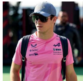
Realidad. Franco sería anunciado entre el 4 y 6 de noviembre.

En la escudería ya se reconoce su capacidad de adaptación, su compromiso y su ascenso interno frente a otros contendientes como Paul Aron, quien aparecía