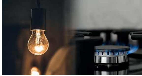
Ajuste. En las tarifas de la luz y el gas en la provincia

La resolución alcanza a EDELAP, EDEA, EDEN y EDES, así como a las áreas de referencia Río de la Plata, Atlántica, Norte y Sur. Para octubre, se incorporan los Precios de Referencia de la Potencia y el Precio Estabilizado de la Energía del Mercado Eléctrico Mayorista (MEM) fijados por la Secretaría de Energía de la