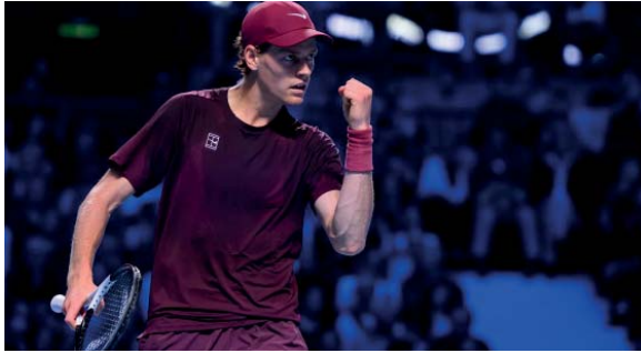
Voraz. Jannik quiere terminar la temporada en la cima.

En caso de quedarse con el título en el Masters 1000 de París, Sinner retornaría al número 1 del mundo: alcanzaría los