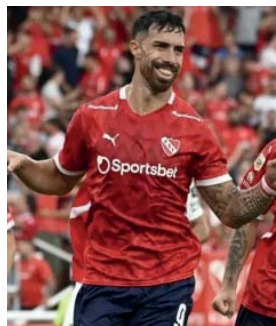
Entonado. Independiente va por su segunda victoria en el certamen.

El conjunto de Gustavo Quinteros llega al duelo luego animado tras golear por 3-0 a Platense el lunes en el cruce correspondiente a la sexta fecha que había sido postergado y que le sirvió para cortar con la sequía de 15 partidos victoriosos. Aquella mala racha había dejado muy resignado a "El Rojo", que ahora marcha último