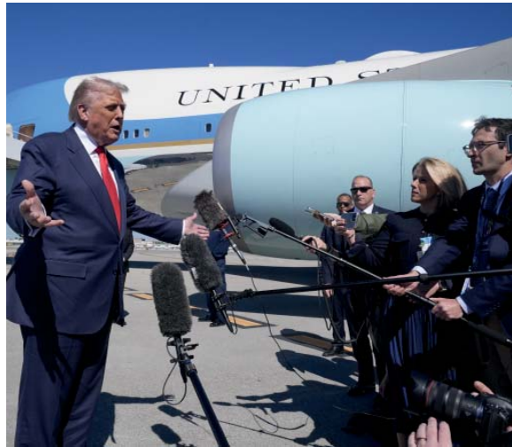
Tajante. Fue la desmentida del líder republicano sobre una eventual incursión en el país sudamericano.

En unos días se espera que llegue al Caribe el portaaviones USS Gerald Ford, el más moderno e importante de la flota estadounidense, que se unirá al resto