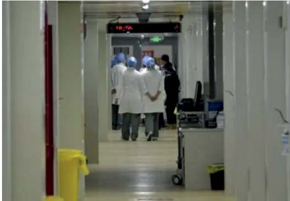
Buenas intenciones. El Gobierno apunta a reforzar el presupuesto hospitalario

La decisión responde a la Ley 27.796, que declaró la emergencia sanitaria en salud pediátrica y en residencias médicas por el término de un año. La normativa, que fue ratificada por el Congreso el 2 de octubre, tras rechazar los vetos del presidente Javier Milei, fue promulgada hace diez días. Sin embargo, su aplicación quedó en suspenso porque, al igual que con la ley que declara la emergencia en discapacidad, el Ejecutivo le solicitó al Parlamento que defina de