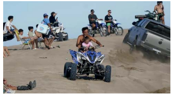
Ecotasa. Por la cantidad de accidentes en La Frontera

Es por el costo para el partido de los servicios médicos y seguridad que involucra el control de la zona, donde suele haber accidentes en verano.