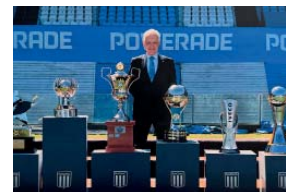
El ex presidente conquistó seis títulos durante su gestión.

Además, le agradeció al actual presidente de la Asociación del Fútbol Argentino, Claudio "Chiqui" Tapia y a la comisión ejecutiva: "Siempre apoyando al fútbol argentino". Por último, tuvo palabras para la