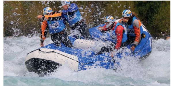
Perseverancia. El combinado nacional intentará quedar en lo más alto.

La localidad de Aluminé será sede del certamen internacional desde el 3 al 9 de noviembre. Nueve equipos representarán a Argentina.