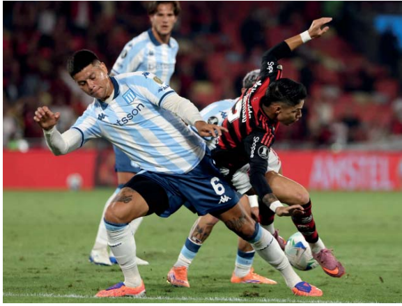
Intensidad. El conjunto de Gustavo Costas deberá sacar garra contra un rival de cuidado.

De cara al duelo decisivo, el técnico mantiene dos incógnitas en la formación titular: en el lateral derecho todavía no se define entre