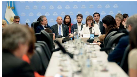
Invitada. Bullrich, ayer, en la Comisión de Presupuesto de Diputados.

Voceros parlamentarios de bloques provinciales señalaron a la Agencia Noticias Argentinas que estas negociaciones se realizarán entre los gobernadores y