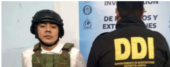
“Señor J”. Fue detenido a fines de agosto.

“No guardo ninguna relación con los detenidos de un hecho de una causa que desconozco”, co-