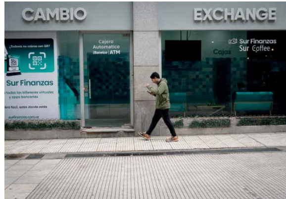
En movimiento. El dólar oficial subió ayer 35 pesos.

Los títulos en moneda dura avanzaron hasta un 1,8% de la mano del Global 2030, luego de que el lunes lo hicieran hasta casi 25%, lo que llevó el Riesgo País del JP Morgan a los 708 puntos básicos. En contraste, el Bonar 2035