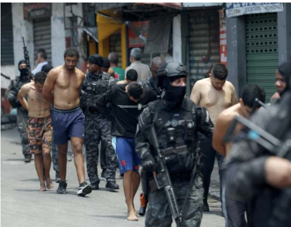
El despliegue. Los operativos se concentraron en los complejos de favelas Alemão y Penha, en la zona norte de Río de Janeiro.

También fueron incautados más de medio centenar de fusiles de asalto y "una cantidad enorme de drogas", según dijo el goberna-