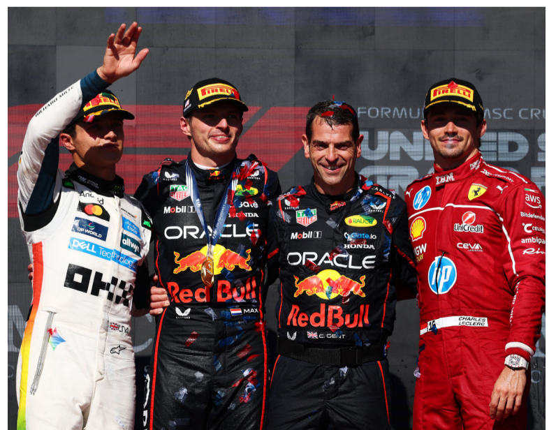
El podio en Estados Unidos tuvo tres colores

La próxima fecha en el campeonato de Fórmula 1 será el próximo domingo 25 de octubre, cuando se dispute el Gran Premio de México.