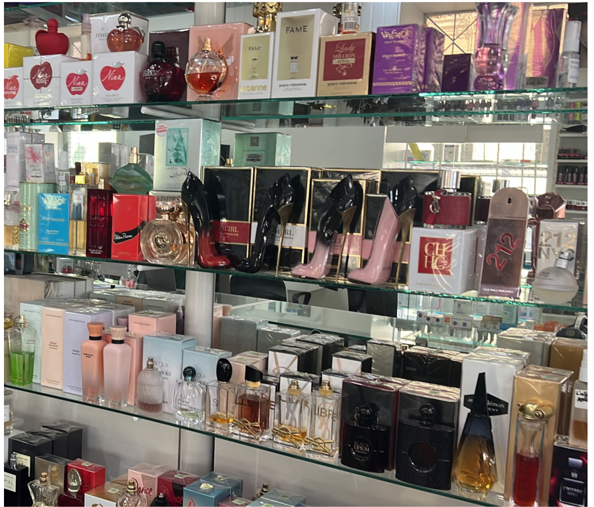
Variedad de perfumes, regalo típico en fechas especiales. EL NORTE

De acuerdo con la Confederación Argentina de la Mediana Empresa (CAME), se trata del cuarto “Día de la Madre” con descenso interanual consecutivo.