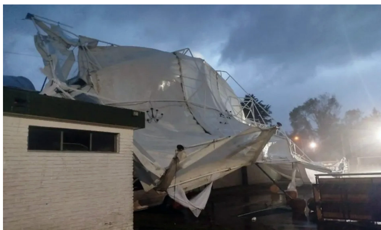
El temporal golpeó con fuerza a Olavarría. Verde TV

El domingo, el SMN había emitido alertas amarillas por vientos