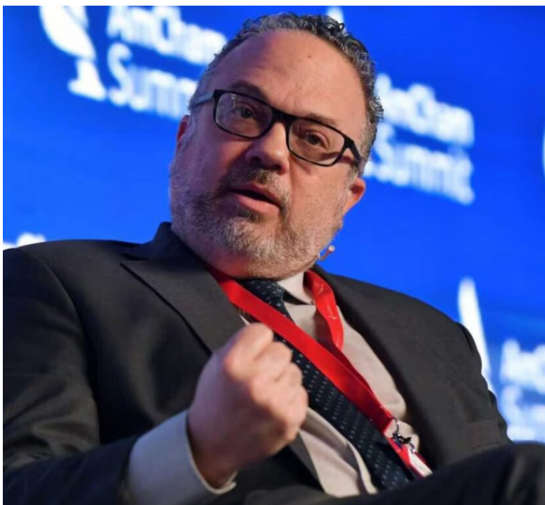
El exministro de Desarrollo Productivo, Matías Kulfas

De cara a lo que sucederá después de los comicios, el economista indicó que el resultado electoral será clave, aunque su impresión es que el gobierno “no va a sacar muy buen resultado”. El riesgo más grande, según Kulfas, es la acumulación de errores de gestión –como los vinculados a la crisis de las LELIQ– y la negación de los mismos. El economista concluyó que el principal peligro radica en que el gobierno no tenga la capacidad de “hacerse cargo de los errores, para poder corregir”.