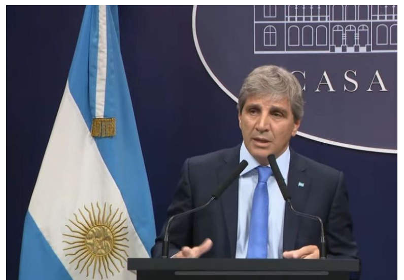
El Ministerio de Economía, Luis Caputo

El fallo también subrayó que el DNU en cuestión no explicita las condiciones ni las razones del empréstito con el FMI, lo que refuerza la necesidad de transparencia: “El derecho a la informa-