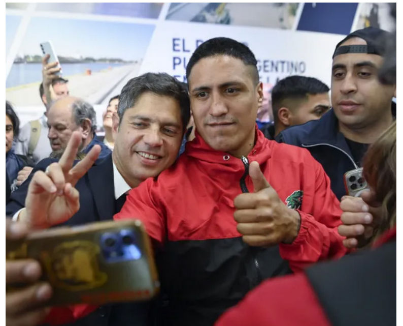
Axel Kicillof en un encuentro en Ensenada.

Y cerró con ironía: "¿O sea que gobiernan los Menem? ¿Votaron a los Menem? ¡Hay cinco Menem en el Gobierno! Estaban infiltrados o estaban camuflados, es una cosa muy rara lo que está ocurriendo. Yo llamo la atención: esto nos lleva a un destino calamitoso". (DIB) MM