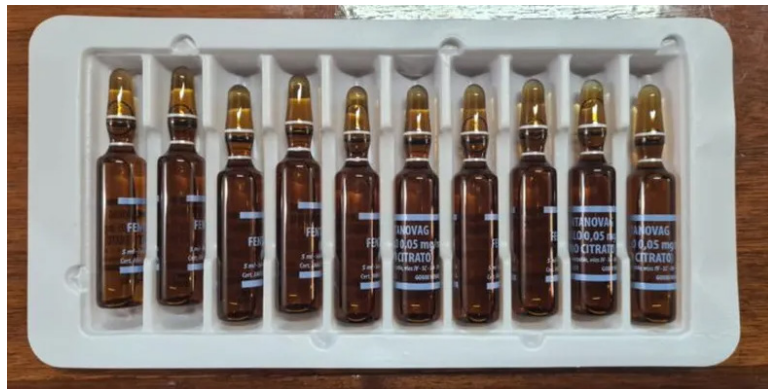
Novedades sobre el fentanilo.

El escrito también detalló que el 28 de noviembre de 2024 una inspección no programada de ANMAT detectó graves deficien-