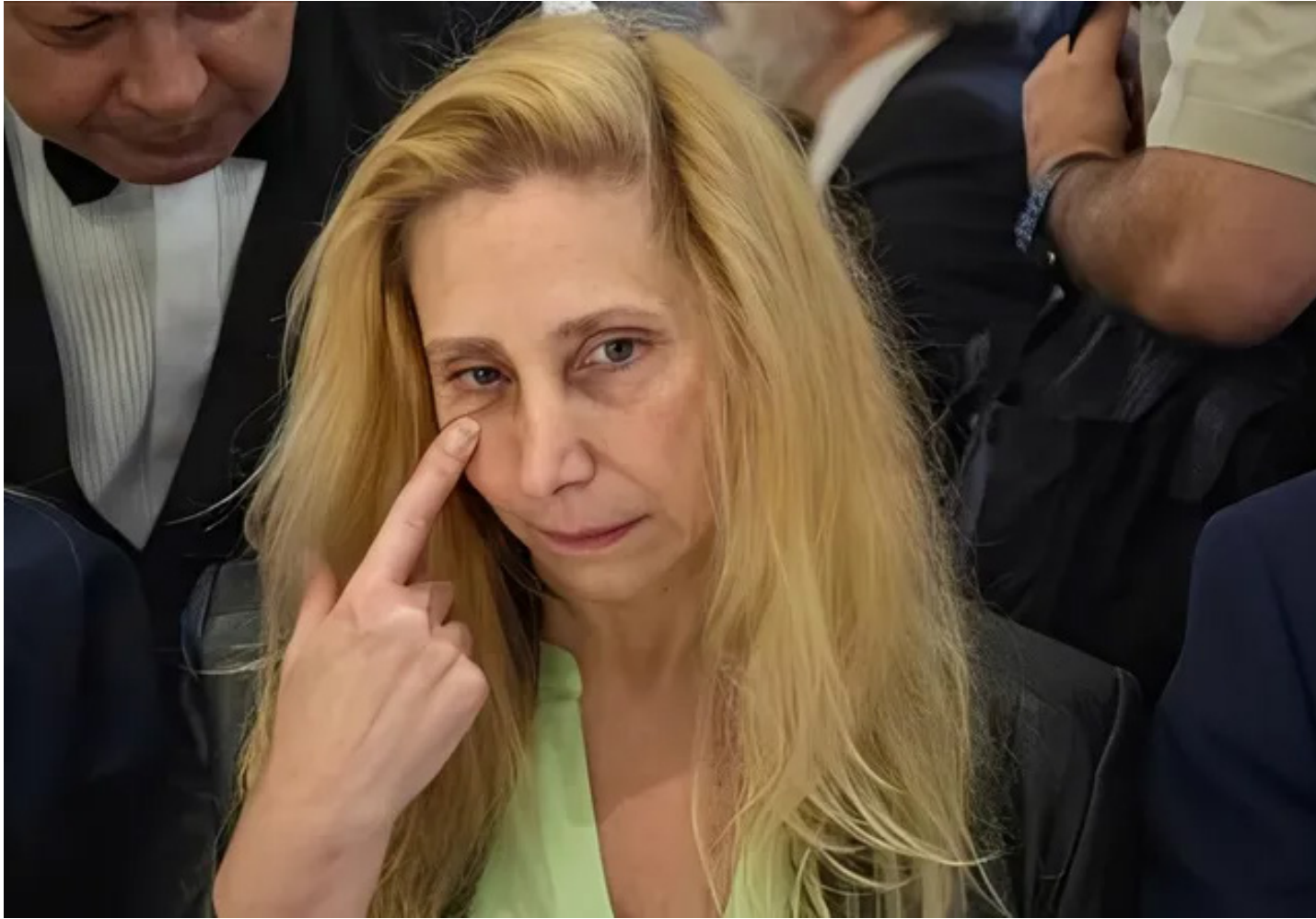
La secretaria general de la Presidencia, Karina Milei en el ojo de la tormenta del escándalo por presuntas coimas